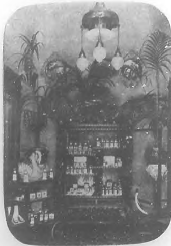
Salón D'Hygiene & de Beauté.—Salón de espera.

Masaje bibratorio manual. Masaje bibratorio eléctrico. Masaje por el vacío. Fototerapia del rostro. Pulverizaciones á vapor. Hidroterapia del semblante. Hay además: Aparatos para adelgazar la nariz.