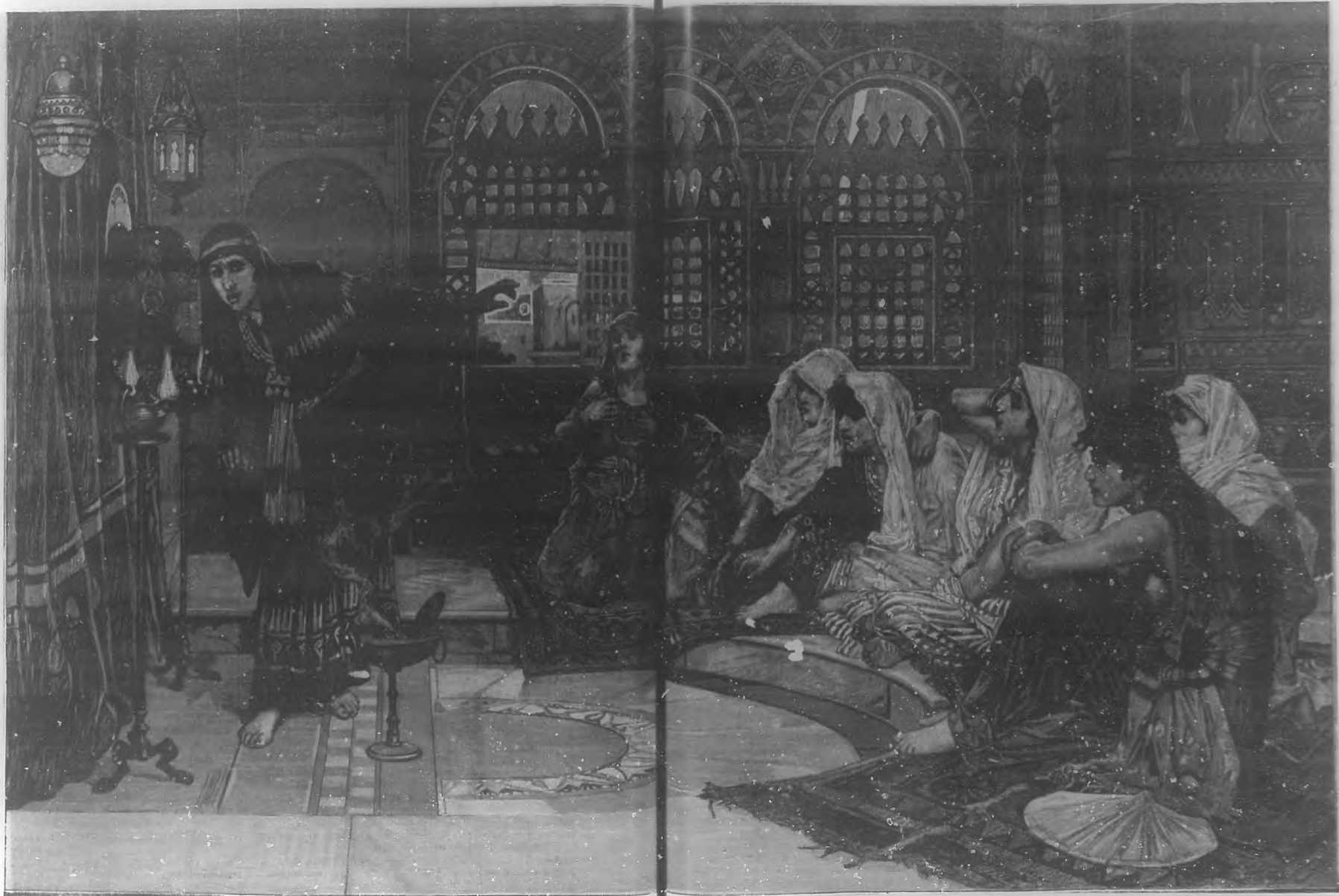
CONSULTANDO EL ORÁCULO por J. W. Waterhouse. Artículo "Alrededor de un arcano").