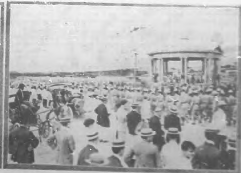
Dos aspectos que ofrecían en su mareo á los entusiastas Guardias Locales que asistieron al recibimiento.