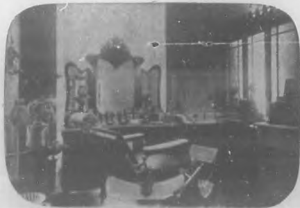
Salón D'Hygiene & de Beauté.—Sala de tratamientos de la belleza.

tos gratis, los que también se le pueden pedir por el teléfono A-4172.