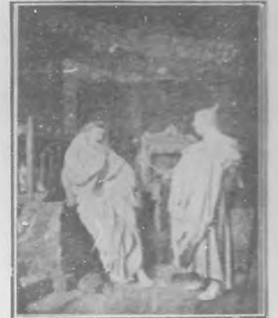
Los augures, Cuadro de Duran.