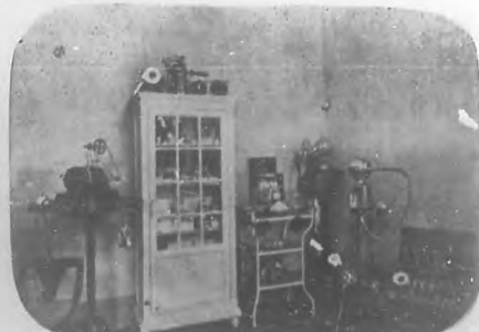
Salón D'Hygiene & de Beauté.—Gabinete de Massage.