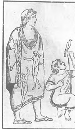
Un agorero en funciones, Antigua pintura etrusca.