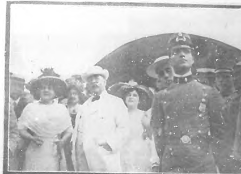
El Pezón de la República José Miguel Gónzalez rodeado de los familiares del General Monteaiguado esperando el desembarco.—Cruce "Cuba" que trajo una parte de las tropas, en el que venía el Estado Mayor.

BOHEMIA saluda con el mayor respeto y más sincero cariño al general Monteaiguado, y á los jefes, oficiales y soldados que tan bien han sabido cumplir su sagrada y honrosa misión en los campos de Oriente.