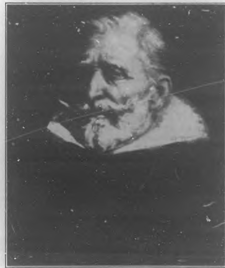
UN HIDALGO, cuadro de Miguel Melero.